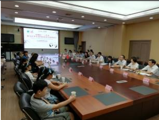
(雅安市雨城区政府表敬訪問)