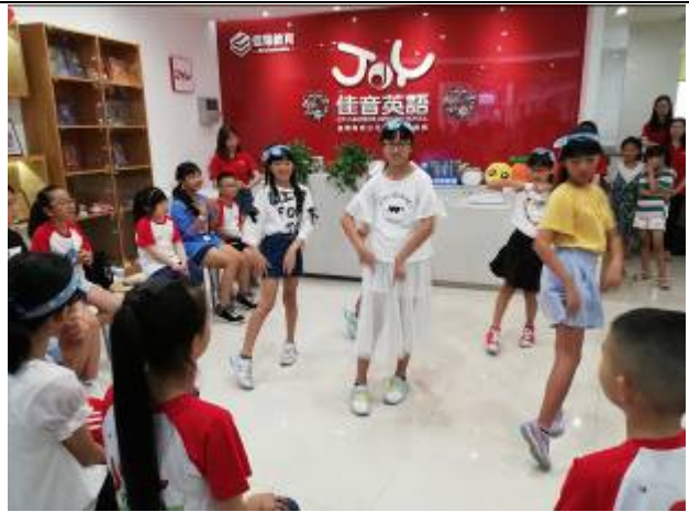
(英語学校での交流会)